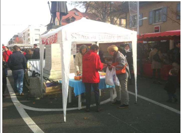
Stand de SET sur le marché de Ferney-Voltaire

• Strasbourg : le 26 avril 2016, conférence-débat organisée par Alsace-Biélorussie , à l'occasion de ses 25 ans, avec la participation très probable de Yves Lenoir.