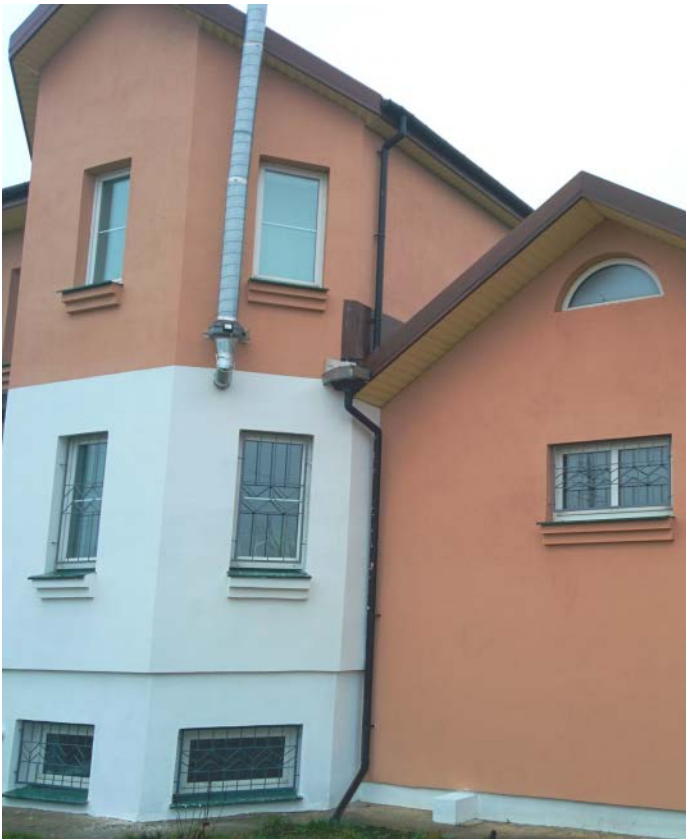
Vue du conduit de fumée du Laboratoire \beta