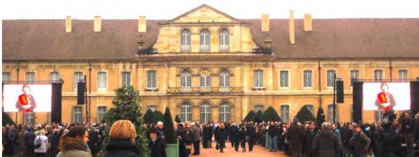
Homage public, le 26 Novembre 2011 dans le Parc de l'Abbatiale de Cluny