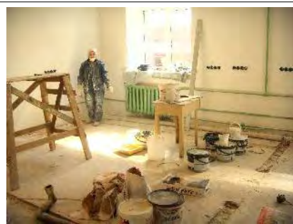
... que les travaux soient terminés (04/2011)