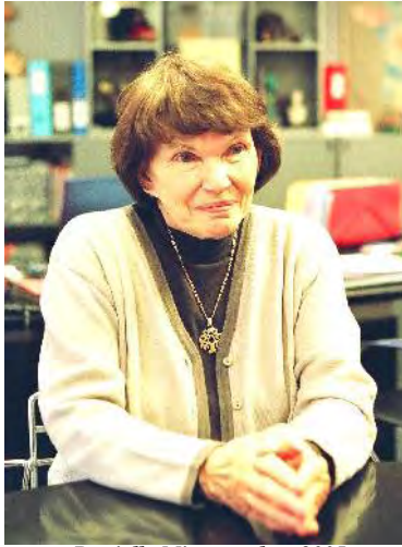
Danielle Mitterrand en 2005

Du 7 au 11 Mai de la même année le journal Les Périphériques vous parlent et France-Libertés , Fondation Danielle Mitterrand organisaient les rencontres des Premiers Fora des Villages et Cités du Monde , à la Cité Universitaire de Paris.