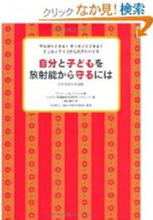
Comment se protéger contre la radio-activité... (2007).

Ainsi qu'annoncé dans le bulletin d'Octobre, ce petit livre a été traduit et adapté pour le Japon. Son auteur l'a présenté au Japan National Press Club le 12 Octobre. La présentation, suivie par une assistance nombreuse, a duré 1h47' dont une bonne partie consacrée à répondre aux questions. Le film de cet événement, sous-titré par notre Webmaster à partir des traductions du russe par Wladimir