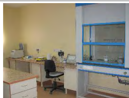
Hotte et table de travail (nouveau laboratoire)