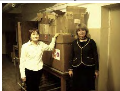
Equipement (don de ETB ) en attente...