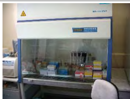
Hotte (don de ETB ) dans l'ancien laboratoire