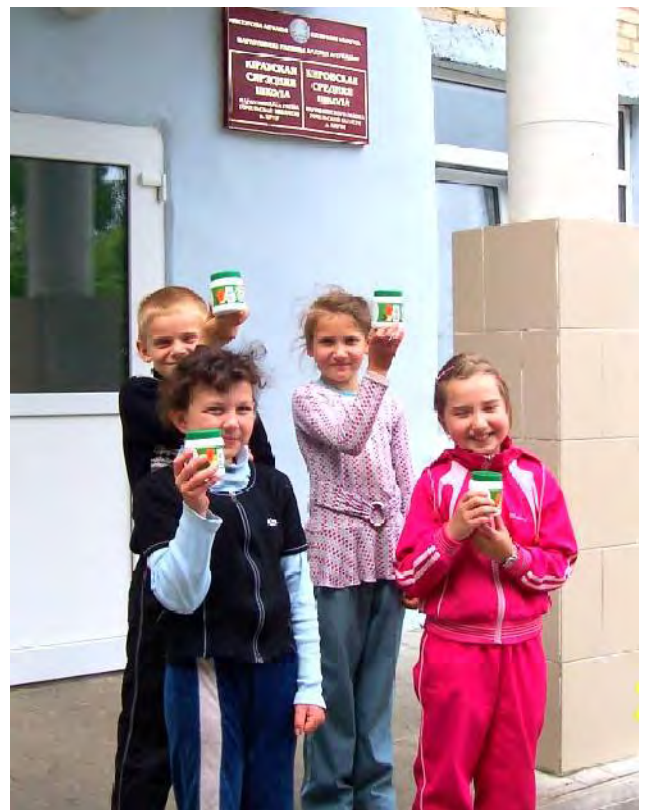
Ecole de Kirov : chacun rentre à la maison avec son Vitapect