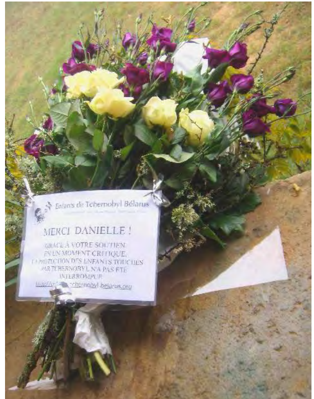
Gerbe déposée par ETB lors de la cérémonie de Cluny